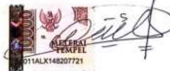
Naila Fathiyya Salsabila