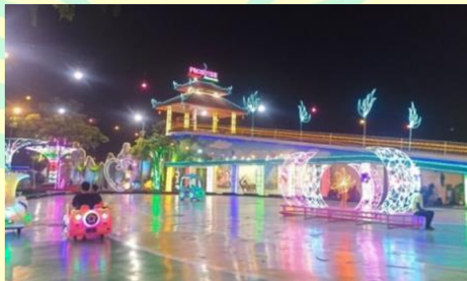
Gambar 1. 1 Foto Lokasi Rainbow Alamanda

memikat, terutama saat malam hari. Saat lampu berwarna-warni menyinari tempat tersebut, suasana menjadi menyenangkan dan memukau. Di sini, tersedia berbagai wahana permainan gratis yang sangat menghibur dan digemari anak-anak, mulai dari perosotan, ayunan, trampolin, hingga mainan pasir dan kuda-kudaan. Selain itu, ada juga wahana berbayar dengan harga terjangkau seperti mandi bola, bom-bom car , animal car , perahu, rumah angin, dan balon spin water untuk menambah keseruan. 5