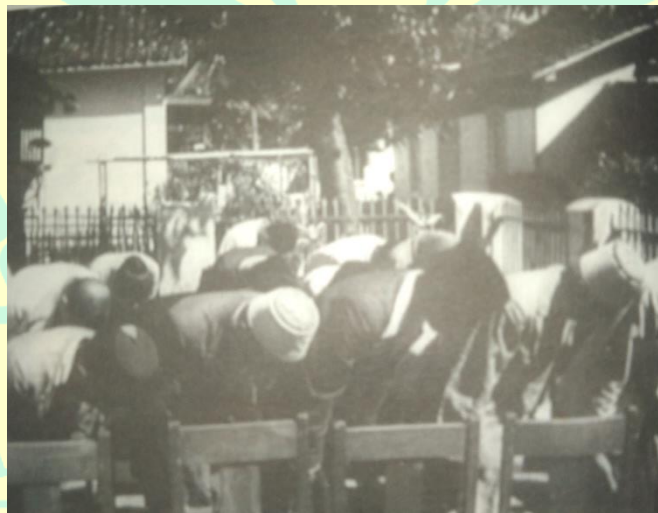
Gambar 3. Penduduk di sebuah desa melakukan saikerei.