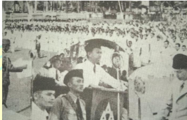
Gambar 2. Rapat Barisan Pemuda Asia Raya memperingati Hari Pemuda Asia yang diselenggarakan Gerakan Tiga A, 7 Juli 1942.