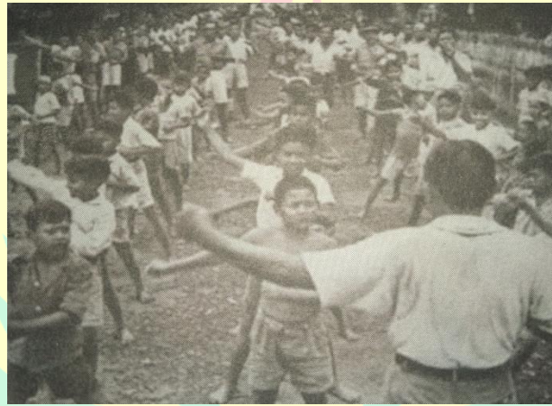
Gambar 1. Kegiatan taiso (senam pagi).