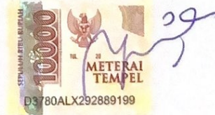
Sela Faztiara Zahra