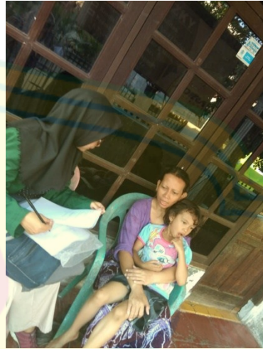
Gambar 3: wawancara responden