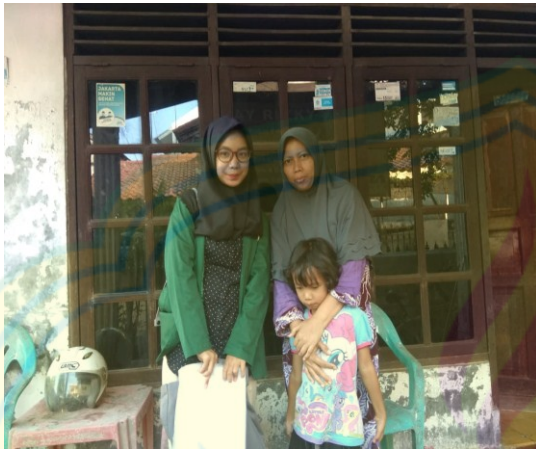
Gambar 5: wawancara responden