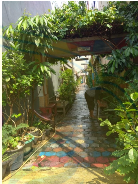
Gambar 6: suasana RW 03