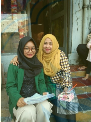
Gambar 1: wawancara responden