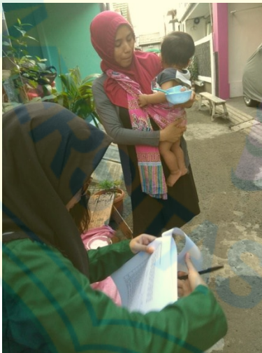
Gambar 2: wawancara responden