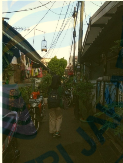
Gambar 4: Kondisi lapangan