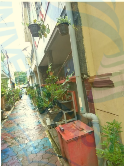
Gambar 7: Suasana RW 03