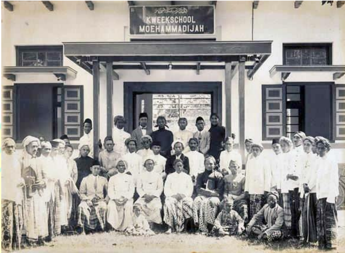
Sumber: Buku digital K.H. Ahmad Dahlan (1868-1923), Museum Kebangkitan Nasional