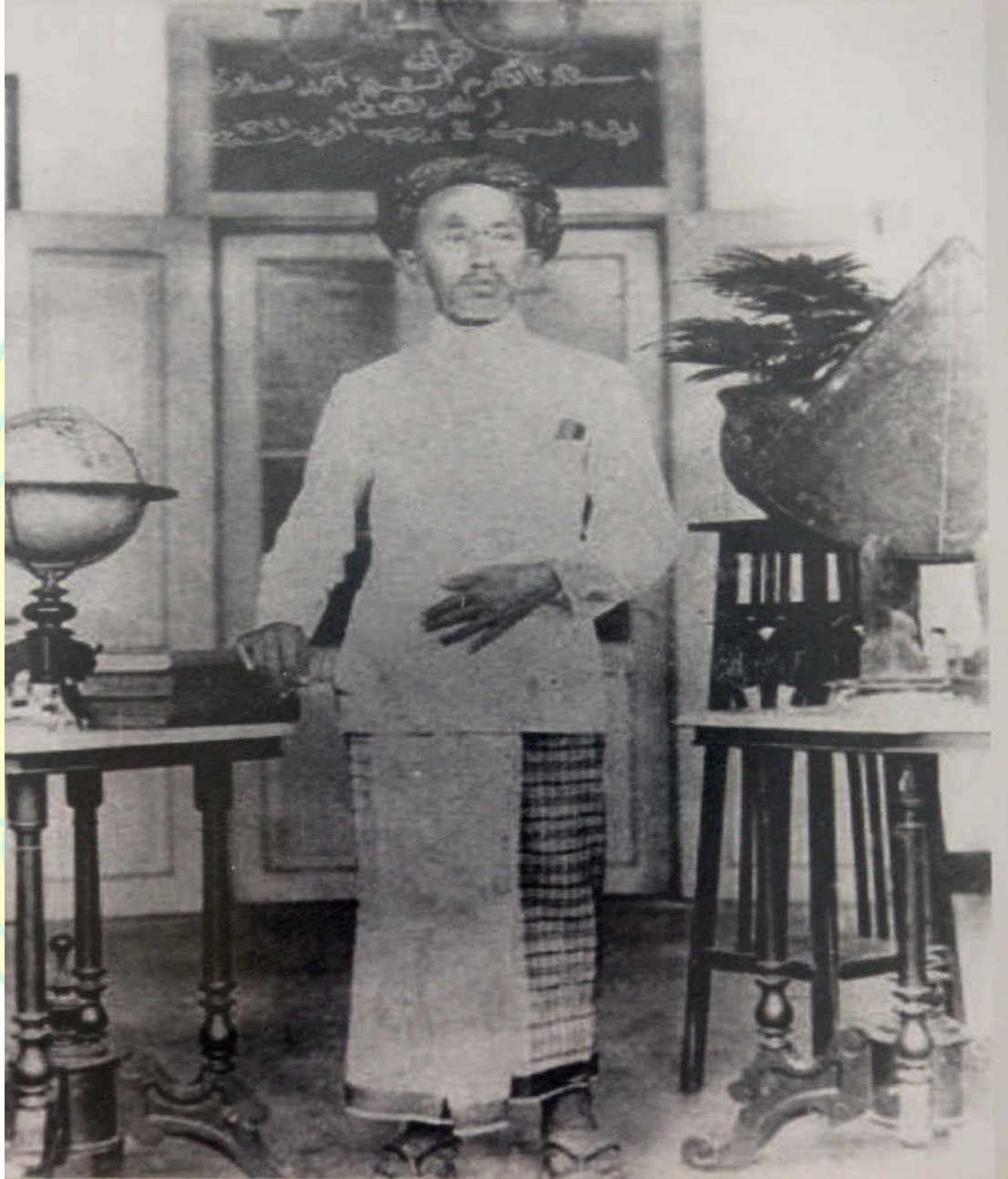
Sumber: Buku digital K.H. Ahmad Dahlan (1868-1923), Museum Kebangkitan Nasional