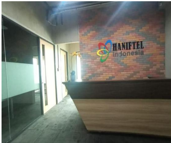
Sarana dan Prasarana PT Hanifitel