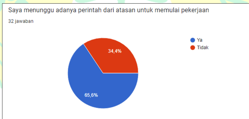
Gambar 1.3 Hasil Pra-Riset Perilaku Guru untuk Memulai Pekerjaan