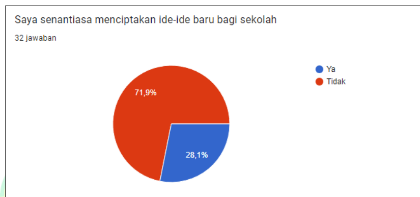
Gambar 1.1 Hasil Pra-Riset Perilaku Inovatif Guru