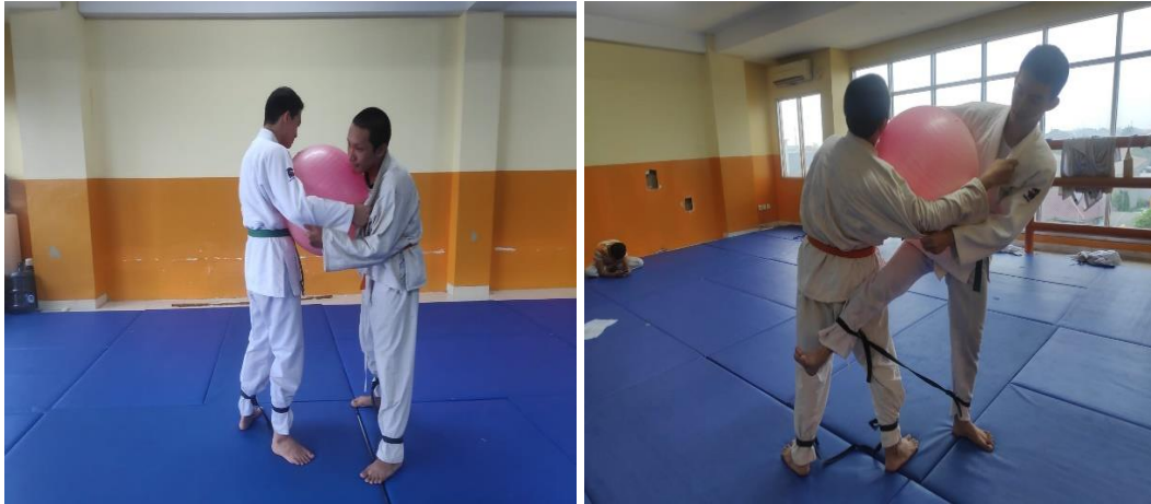
18. Osoto gari resistant the gym ball ( level intermediate )