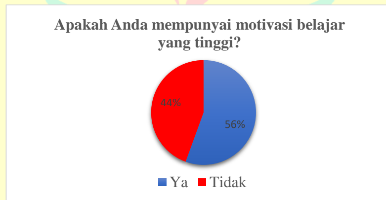
Cuplikan 1. 1 Data Prariset Motivasi Belajar Siswa

Selain mengumpulkan data tentang lingkungan sekolah di SMK Negeri 51 Jakarta, peneliti juga melakukan pra-penelitian kepada 36 siswa di XI MPLB. Berikut adalah temuan peneliti: