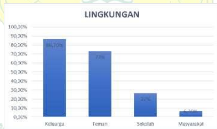
Gambar 1.3 Grafik Lingkungan Motivasi Belajar Siswa

Motivasi siswa saat belajar dipengaruhi beragam aspek, diantaranya yakni lingkungan. Siswa akan lebih mudah menguasai materi dengan kondisi dan suasana lingkungan yang mendukung termasuk motivasi belajar (Dwiyanti & Ediati, 2020). Lingkungan juga dapat menjadi suatu acuan atau pandangan untuk menentukan arah maupun tujuan yang dikehendaki siswa. Hal ini didukung oleh penelitian Poondej & Lerdpornkulrat (2016) yang mengungkapkan bahwa cara belajar siswa dipengaruhi oleh persepsi siswa terhadap lingkungan belajar mereka. Ini termasuk bagaimana cara siswa mengerjakan tugas yang telah diberikan guru. Oleh karena itu, kondisi lingkungan berperan penting dalam mempengaruhi minat dan motivasi belajar siswa (Wahyuni dan Husna, 2020).