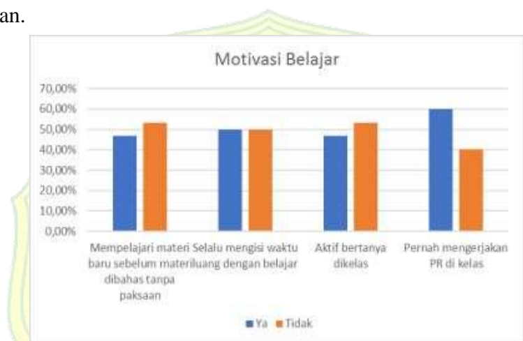
Gambar 1.2 Grafik Motivasi Belajar Siswa

beberapa siswa yang fokus memperhatikan penjelasan guru dan sisanya tidak memperhatikan penjelasan guru dengan baik seperti mengobrol dengan teman, menggunakan ponsel secara diam-diam, mengerjakan tugas rumah di saat pembelajaran berlangsung, memiringkan kepala di meja seakan-akan tidur di kelas, dan tindakan lainnya yang menggambarkan ketidakkfokus siswa dalam pembelajaran.