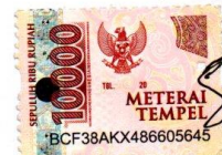
Shafa Eisyia Bunga Aprilla