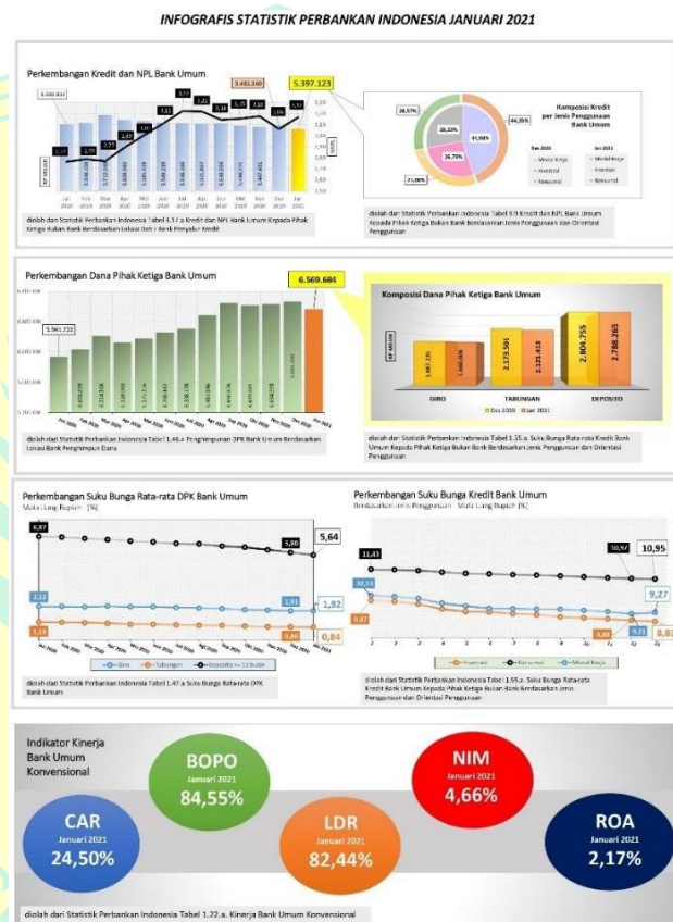
Gambar 1. 1 Data Penggunaan Statistik Perbankan

lonjakan penggunaan mobile banking dan internet banking tahun ini. Akselerasi transformasi digital antara lain terkait fenomena menurunnya jaringan bank dari 2017 sampai Agustus 2021 terdapat sejumlah 2.593 kantor mengalami penurunan, tetapi ada peningkatan transaksi mobile banking dan internet banking (Dwi, 2022).