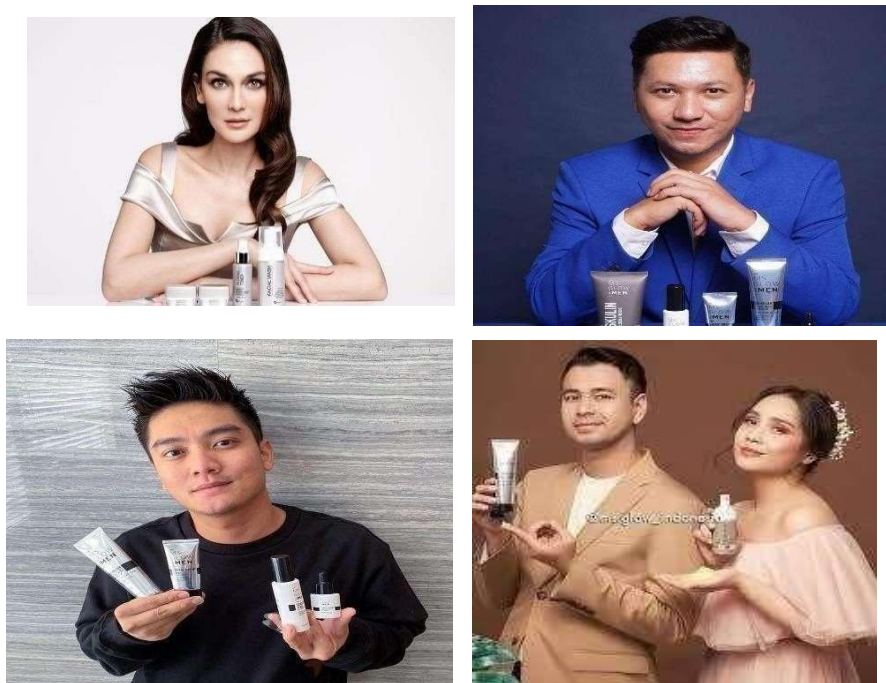
Gambar 1. 5 Celebrity Endorser MS Glow