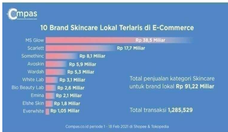
Gambar 1. 3 Brand Skincare lokal terlaris

seluruh Indonesia. Produk kecantikan MS Glow juga mengandung bahan yang tidak berbahaya sehingga aman bagi ibu hamil maupun ibu menyusui. MS Glow mengeluarkan produk tidak hanya untuk perempuan tetapi juga untuk laki-laki. Dengan banyaknya produk skincare yang sudah beredar di Indonesia seperti MS Glow, Scarlett, Avoskin, Somethinc, dan Cosrx yang membuat nama-nama skincare tersebut menjadi semakin terkenal dalam beberapa tahun terakhir.