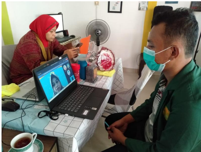
WAWANCARA DENGAN KEPALA PKBM, TUTOR, WARGA BELAJAR (ONLINE)