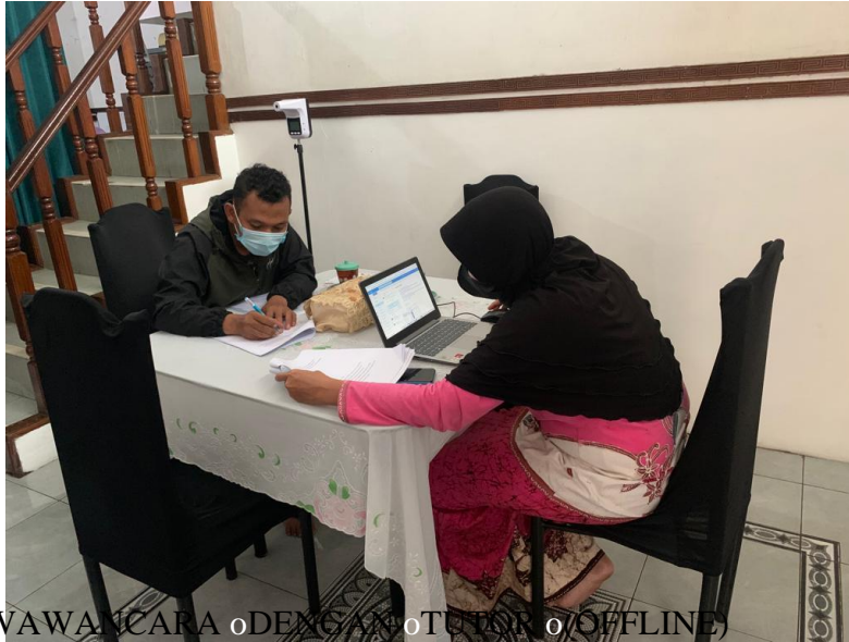
WAWANCARA DENGAN TUTOR (OFFLINE)