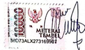
Bella Astri Oktavia