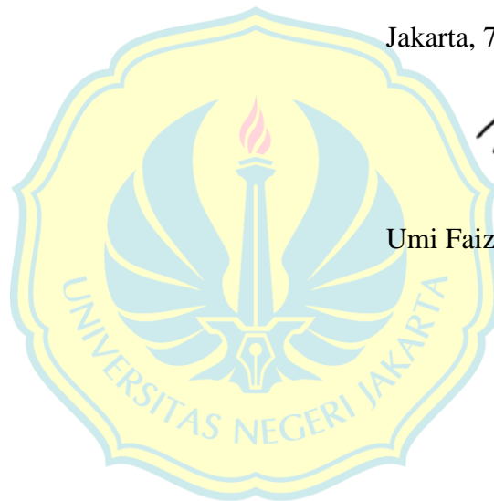
Umi Faizatul Baroroh