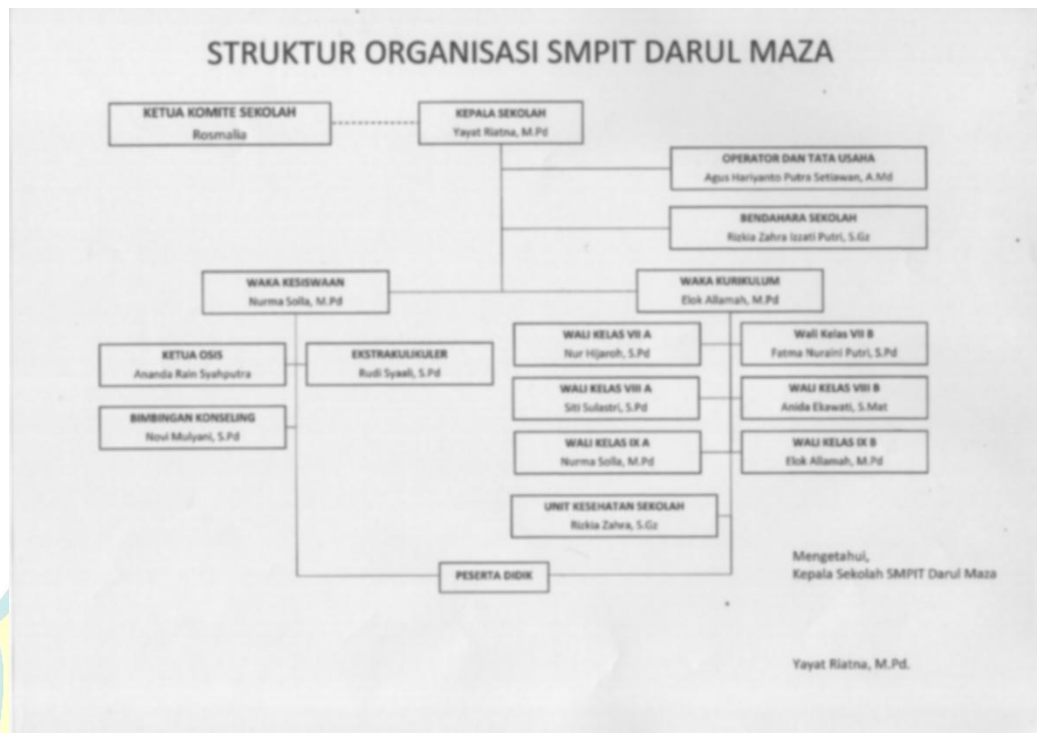
Gambar 4. 1 Struktur Organisasi Sekolah SMPIT Darul Maza Bekasi