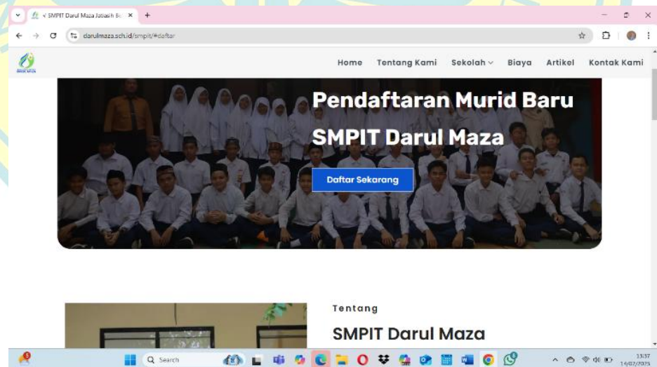
Gambar 4. 6 Website Sekolah SMPIT Darul Maza Bekasi

Website SMPIT saat ini masih aktif yang diisi dengan berbagai informasi seputar SMPIT Darul Maza Bekasi serta foto-foto kegiatan siswa di sekolah atau di luar sekolah, informasi tersebut yang diperbarui secara berkala oleh tim kreatif SMPIT Darul Maza Bekasi. Website ini juga dapat digunakan untuk mendaftarkan diri bagi calon peserta didik baru. Selain itu SMPIT Darul Maza juga menggunakan salah satu media sosial yaitu instagram, sebagai ajang promosi kepada masyarakat luas terkait program pendidikan, prestasi siswa, dan ucapan pada hari Nasional yang dimuat dalam bentuk flyer kemudian disebarluaskan melalui laman instagram. Berikut gambar website sekolah SMPIT Darul Maza Bekasi dan akun instagram: