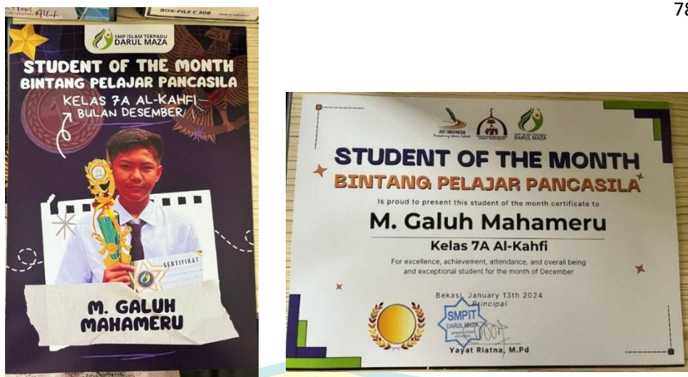
Gambar 4. 3 Sertifikat dan Flyer “ student of the month ”