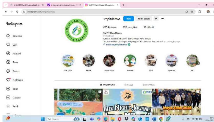
Gambar 4. 7 Akun instagram SMPIT Darul Maza Bekasi

Peneliti melakukan studi dokumentasi terhadap hasil survei kepuasan tenaga pendidik dan kependidikan terhadap sistem informasi di SMPIT Darul Maza sebagai berikut: