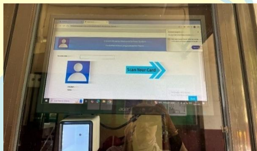
Gambar 4. 5 Mesin Scan Absensi Siswa, Pegawai SMPIT Darul Maza Bekasi

Dapat disimpulkan SMPIT Darul Maza sudah memiliki inovasi dalam program pendidikannya, hal tersebut sebagai bentuk upaya membenahan diri dalam meningkatkan mutu pendidikannya, dengan melakukan berbagai inovasi pada kurikulum dan program pendidikan dengan tujuan untuk memudahkan kerja guru, integrasi data, dan disiplin siswa.