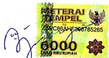
Ajeng Nur Isvianti