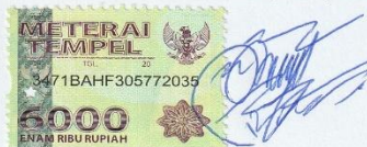
Fahad Ainun Najib