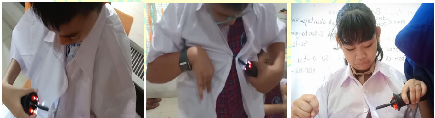
(Peserta didik ketika melakukan tahapan mengkaitkan kancing kedalam kawat dan menarik kancing keluar dari lubang kancing)