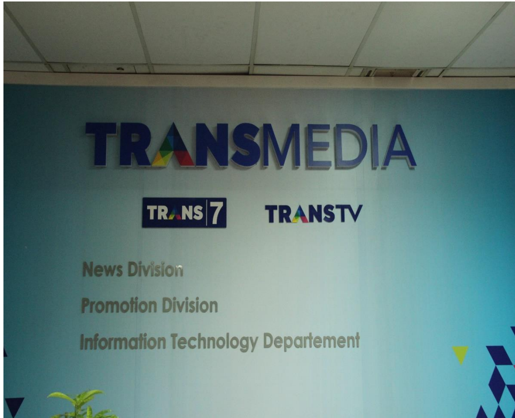
Sumber: Dokumentasi oleh penulis (kantor lantai 5)