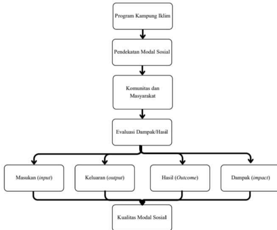
Skema 1.2 Hubungan Antar Konsep