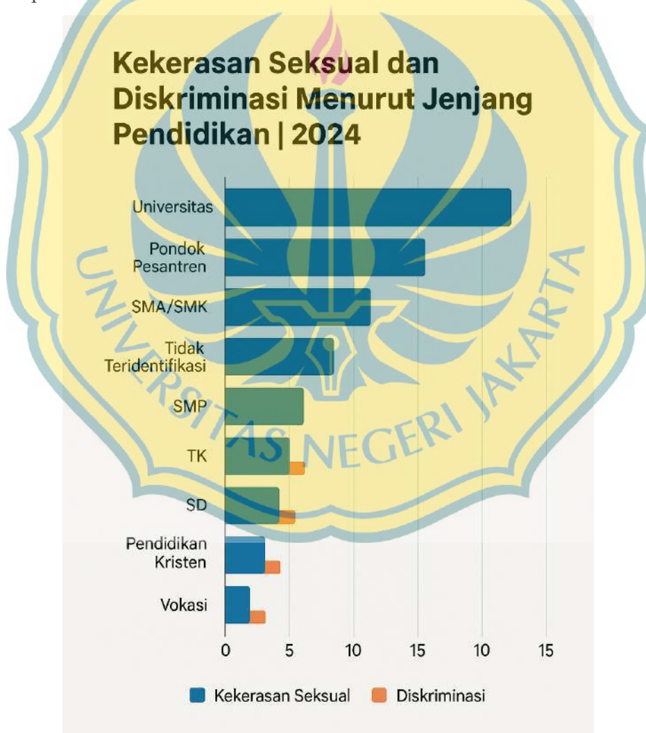
Gambar Diagram 1.1 Kekerasan Seksual dan Diskriminasi Menurut Jenjang Pendidikan.

terjadi di pesantren akhir-akhir ini marak diberitakan. Mulai dari kasus meninggalnya salah satu santri di Pesantren Daar El-Qolam pada 07 Agustus 2022 karena berkelahi dengan teman-temannya, lalu disusul kasus serupa dari pesantren Darul Qur'an Lantaburo Tangerang pada 27 Agustus 2022 dan yang tak kalah mengejutkan adalah wafatnya salah satu santri di Pesantren Darussalam Gontor akibat dianiaya oleh santri senior pada waktu yang bersamaan (CNN Indonesia.com 2022). Musibah yang mencoreng dunia pesantren belum usai sampai disitu saja apabila kita melihat data kasus kekerasan seksual yang terjadi di pesantren. Merujuk pada merujuk pada data yang dirilis oleh Komnas Perempuan, KPAI, dan Kementerian PPPA pesantren menempati urutan kedua perihal kasus kekerasan seksual pada Januari 2024-Desember 2024.