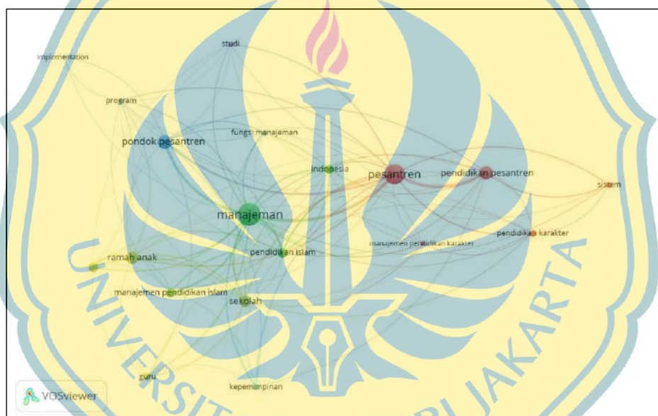
Gambar 1. 3 Research Gap

Berdasarkan hasil penelusuran terhadap artikel-artikel dengan software Publish or Perish (POP) , kemudian dilakukan analisis bibliometric dengan memanfaatkan software VOSviewer untuk menganalisis lebih lanjut tentang manajemen pesantren ramah anak dalam mencegah perilaku kekerasan di pesantren atau keterkaitannya dengan tema atau topik yang lain, memperkuat posisi penelitian yang akan dilakukan dan menemukan research gap pada penelitian ini. Hasil analisis bibliometrik tersaji dalam gambar dibawah ini: