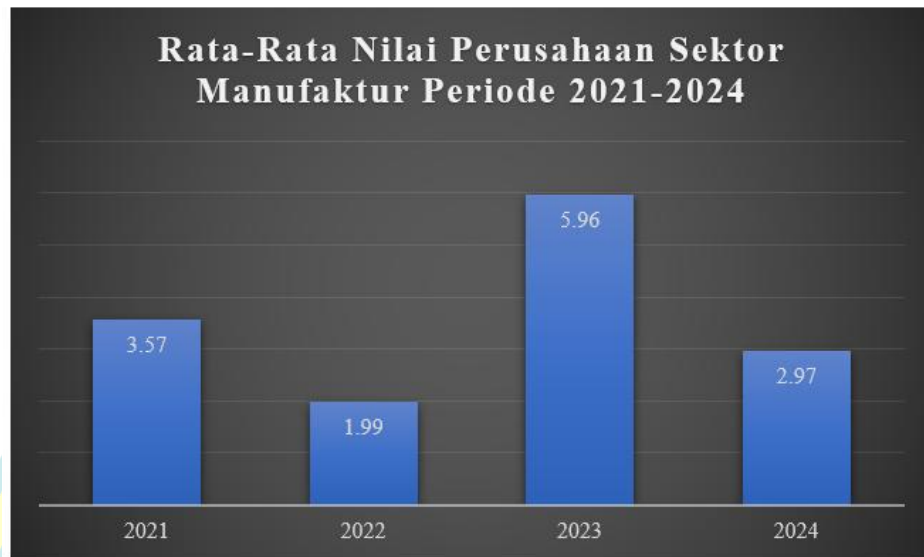
Gambar 1.2 Tren Rata-Rata Nilai Perusahaan pada Sektor Manufaktur selama Periode 2021-2024