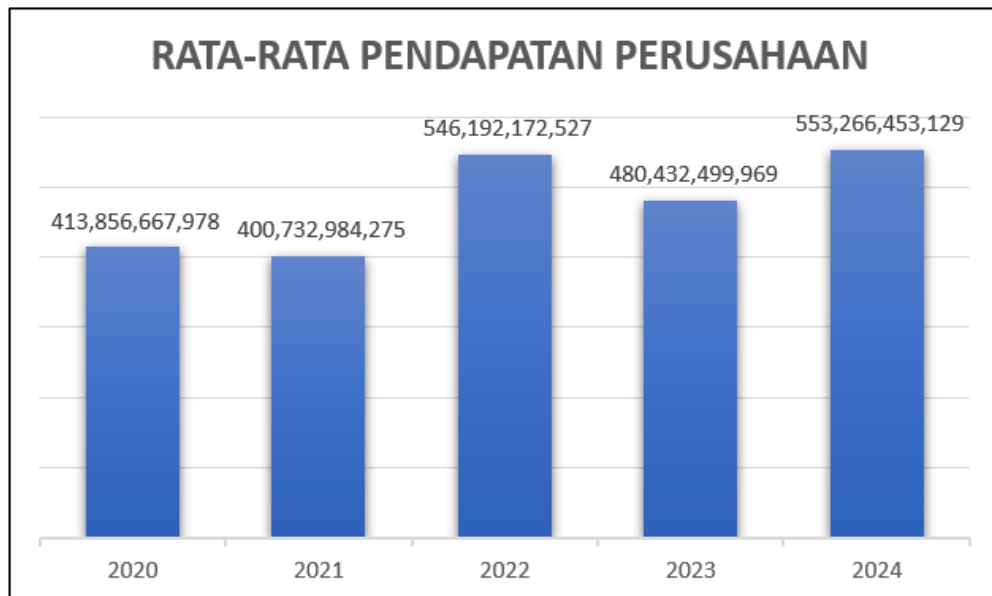
Gambar 1. 1 Rata-Rata Pendapatan Perusahaan Sektor Transportasi dan Logistik Periode 2020-2024