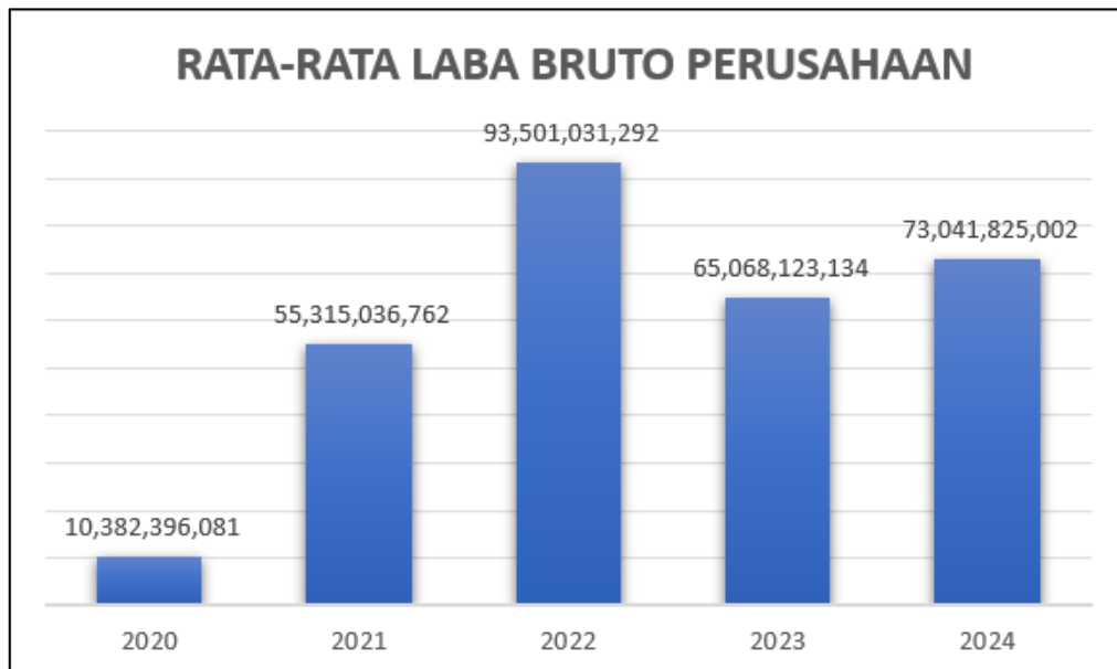
Gambar 1. 2 Rata-Rata Laba Bruto Perusahaan Sektor Transportasi dan Logistik Periode 2020-2024