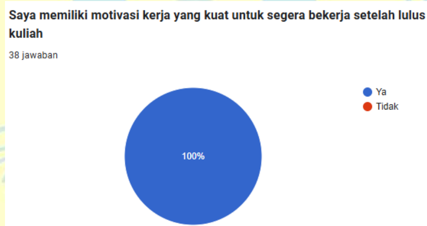
Gambar 1.3 Diagram Hasil Prariset Motivasi Bekerja setelah Lulus Kuliah

Berikutnya pada Gambar 1.3 dibawah ini, berdasarkan dengan hasil pra-riset terhadap 38 mahasiswa, seluruh responden (100%) menyatakan bahwa mereka mengemban motivasi kerja kuat untuk sesegera mungkin terjun ke dunia bekerja setelah merampungkan studi perkuliahan dan tidak ada satu pun mahasiswa yang menjawab “tidak” terhadap pernyataan ini.