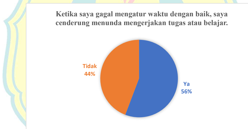
Gambar 1.1 Hasil Pra-Riset terkait Manajemen Waktu dan Prokrastinasi Akademik

Dengan adanya fenomena yang peneliti temukan, peneliti melakukan studi pendahuluan melalui penyebaran kuesioner kepada dua kelas XI MPLB di SMKN 21 Jakarta dengan jumlah 52 responden. Kuesioner studi pendahuluan tersebut terdiri dari dua pertanyaan dengan jawaban Ya/Tidak. Hasil studi pendahuluan disajikan dalam bentuk diagram. Diagram tersebut akan disajikan dalam Gambar 1.1, kemudian tersedia pula dalam Gambar 1.2 beserta penjelasan hasil studi pendahuluannya.